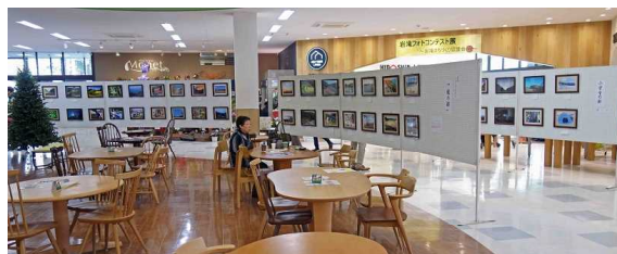
今、エブリ東山店で展示会をしています。 どうぞご覧ください。12/23～1/8