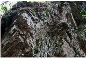
褶曲したチャートの地層

涼しくて気持ちの良いところでしょう。イワナがいます。うな岩陰やタプンと深くなった淵がいたるところにあり、魚釣りの好きな人にはいい所です。