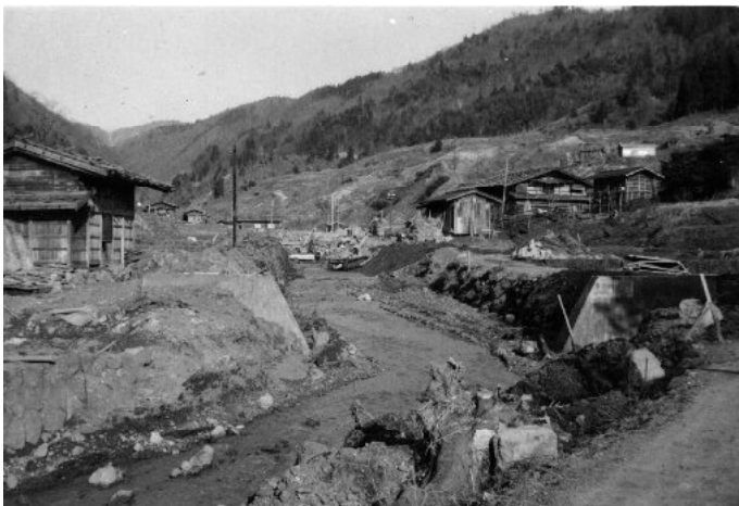
生井川の復旧工事 昭和34年

昭和33年の豪雨後、数年がかりで復旧工事が進められ、蛇行していた生井川は川底が掘り下げられ、まっすぐな石積み護岸の川となり、上流には堰堤の石は岩滝の石が使われました。