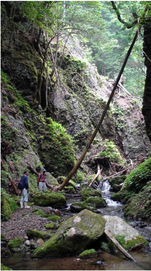
このあたりで川を離れ、左側の崖をよじ登って昔の林道へ出て帰りました。

昔は奥まで林道が整備されていて、切り出した材木を積んだ4トントラックが走っていたのですが、誰も通らなくなりました。今は、崩れてきた土砂が積もって林道がほとんど形も分からなくなっています。奥へ行くにつれて、兩岸はそ