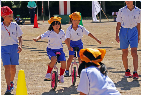
一輪車演技 1年生も上手に乗れるようになりました。