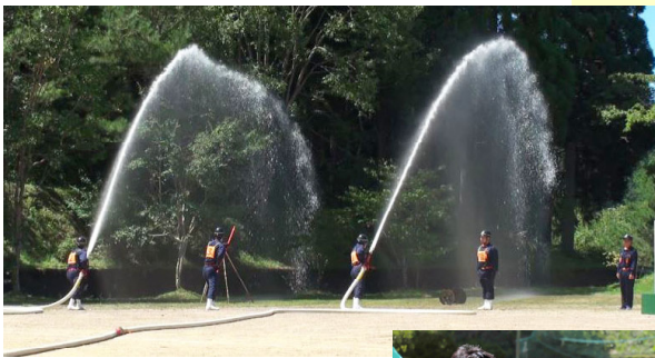
消防団による 消防操法の披露