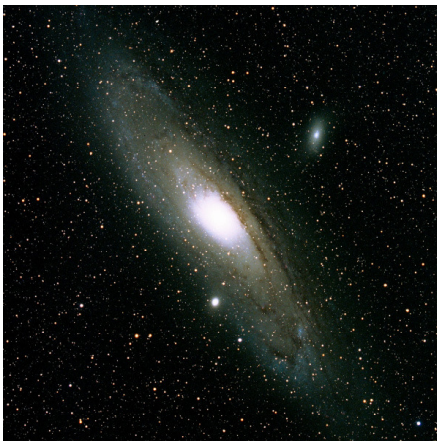
アンドロメダ星雲 M31

期日 10月28日(月)・29日(火)・30日(水) 時間 午後7:00~8:30 場所 岩滝小学校グラウンド