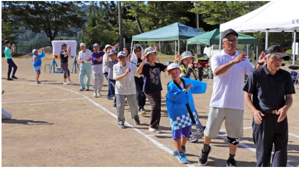
岩滝やんさ・少ヶ野おどり