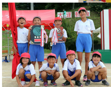
応援合戦優勝 赤団