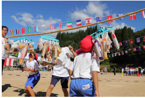
町内対抗パン喰い競走