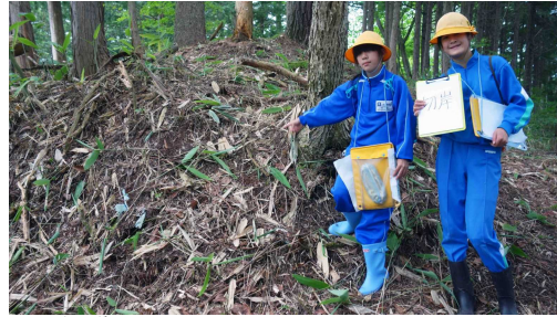
きりぎし 切岸 (切り落として造った崖)