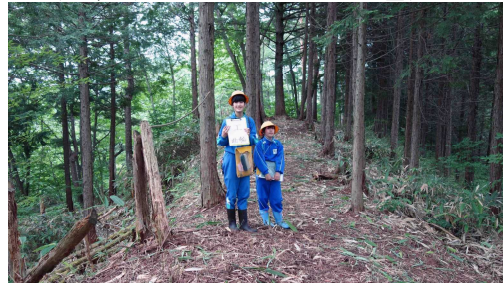
くるわ 曲輪 工 (写真の左右がきりぎし)