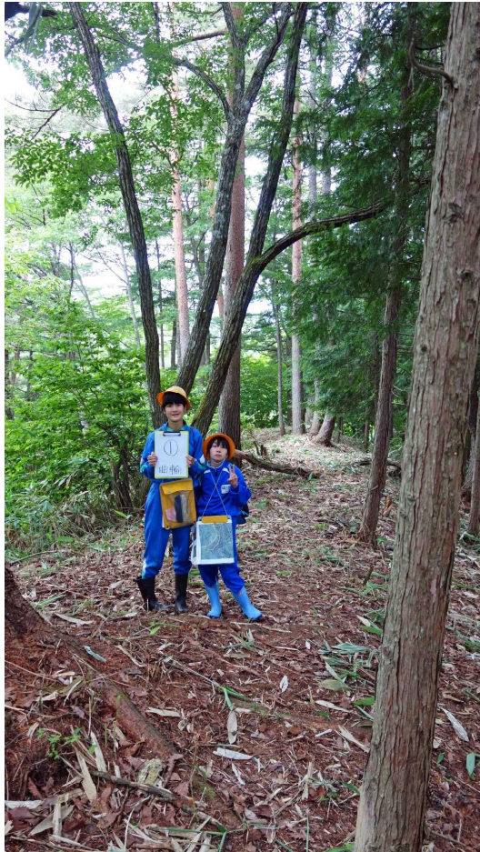
くるわ 曲輪 ① (頂上にある曲輪)