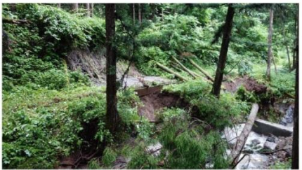
滝川・用水撮り入れ口