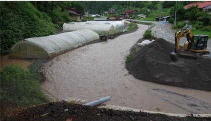
生井川・土砂堆積