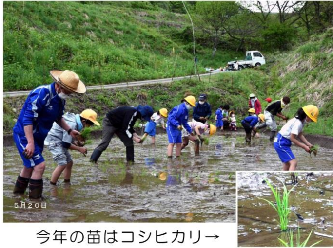
今年の苗はコシヒカリ→