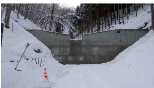
岩滝公民館横に大きな 谷止め完成