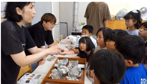
化石（光記念館から）